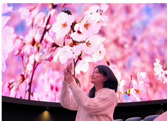
△ ウェルカム映像上映の様子（イメージ）