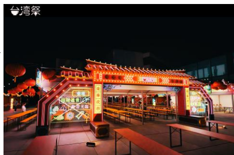
△台湾祭in 東京スカイツリータウン® 2025 (イメージ)