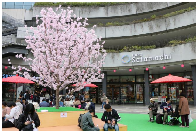
△ソラマチひろばの桜の造花（過去の様子）