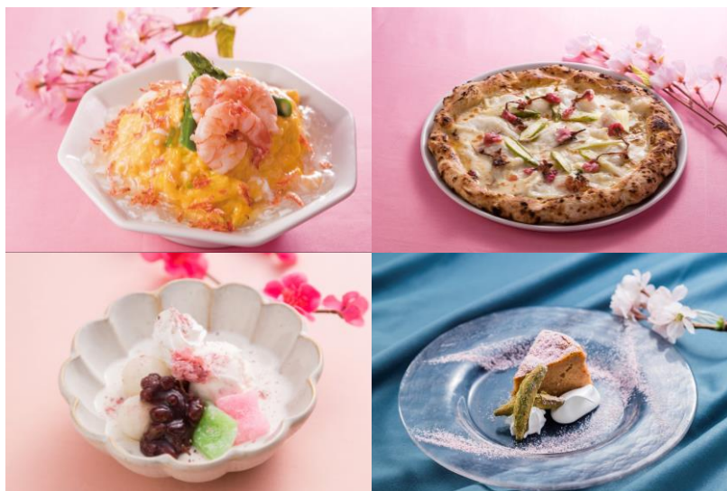
△ さくらメニュー&スイーツ (イメージ)