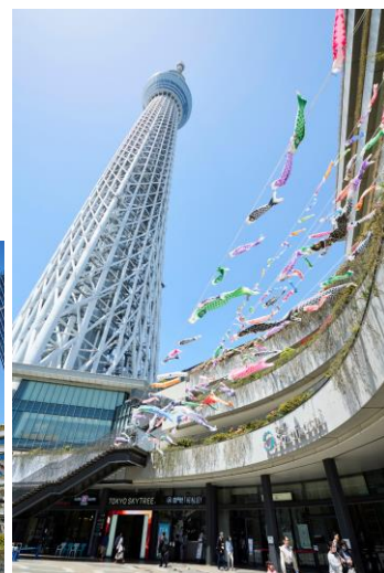
△東京スカイツリータウン® こいのぼりフェスティバル (昨年の様子)

東京スカイツリータウンでは、今年もゴールデンウィーク期間を中心に様々なイベントを開催します。イベントの詳細は決定次第お知らせします。