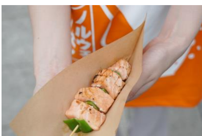
△ノルウェーサーモンBBQ