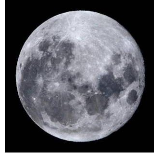
△天体望遠鏡で見る中秋の名月(イメージ)