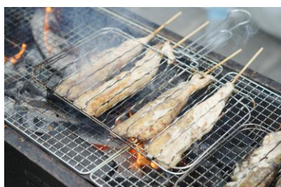
△サバヌーヴォー炭火焼