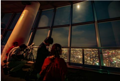
△天望デッキでの名月観賞会(過去の様子)

2017年、「特に後世に残したい名月」として「日本百名月」にも認定された東京スカイツリーの展望台からの名月をお楽しみください。