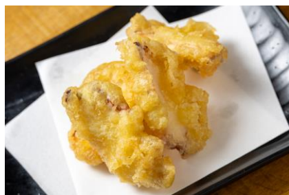
△タコからこだわりボン酢