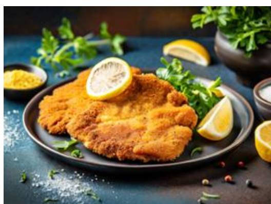
△特大シュニッツェル