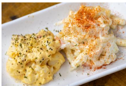
△マカポテトサラダ