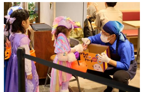
△ Trick or Treat フェア(昨年の様子)