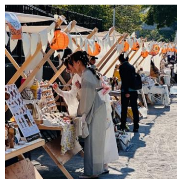
△隅田川マルシェ（過去の様子）