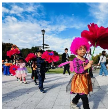
△「隅田川マルシェ」でのパレード（過去の様子）