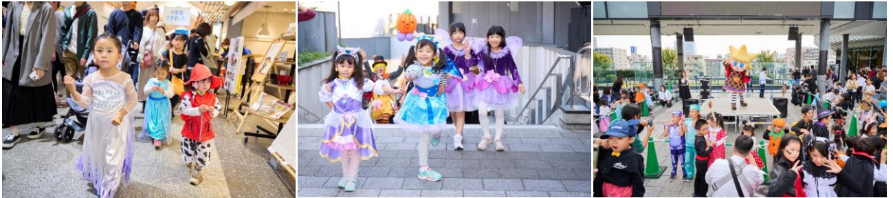
△ハロウィンファミリーパレード(昨年の様子)